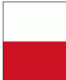
สีประจำโรงเรียน ขาว - แดง

ตราประจำโรงเรียน ประกอบด้วยวงกลมซ้อนกันสองวง วงกลมวงในมีตราสัญลักษณ์ของโรงเรียนในเครือฯ และมีชื่อโรงเรียนเป็นภาษาอังกฤษ “ASSUMPTION COMMERCIAL SCHOOL” อยู่ด้านล่าง ส่วนวงกลมวงนอกมีชื่อโรงเรียนเป็นภาษาไทย “โรงเรียนอัสสัมชัญพาณิชย์การ” อยู่ด้านบน และมีข้อความ “เขตสาทร กรุงเทพมหานคร” อยู่ด้านล่าง ซึ่งตราประจำโรงเรียน แสดงถึง สถาบันการศึกษาที่มีความมั่นคง มีคุณภาพในการให้การศึกษา อบรม กล่อมเกลาเยาวชนทุกคนที่เข้ามาเรียนยังสถาบันแห่งนี้