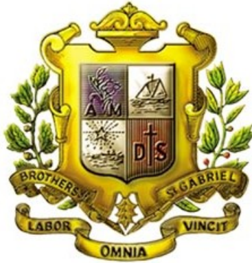
ตรามูลนิธิคณะเซนต์คาเบรียลแห่งประเทศไทย

โรงเรียนนี้มีชื่อว่า โรงเรียนอัสสัมชัญพาณิชย์การ เป็นโรงเรียนในเครือมูลนิธิคณะเซนต์คาเบรียลแห่งประเทศไทย