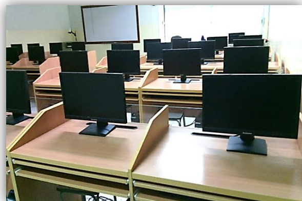
ห้องปฏิบัติการคอมพิวเตอร์ 1