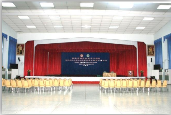
หอประชุม