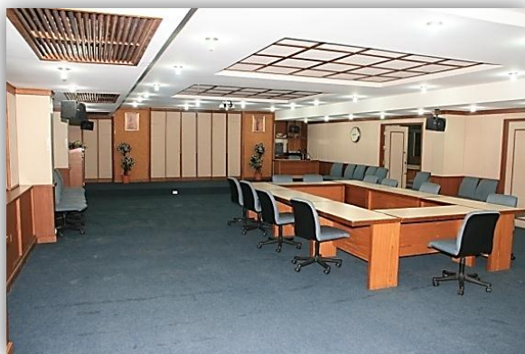
ห้องประชุม/สัมมนา