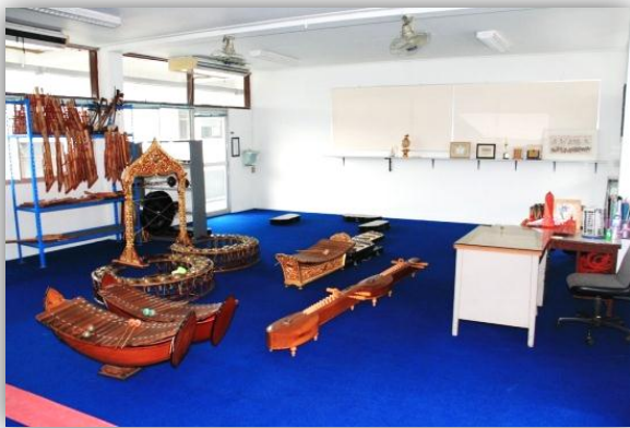
ห้องดนตรีไทย