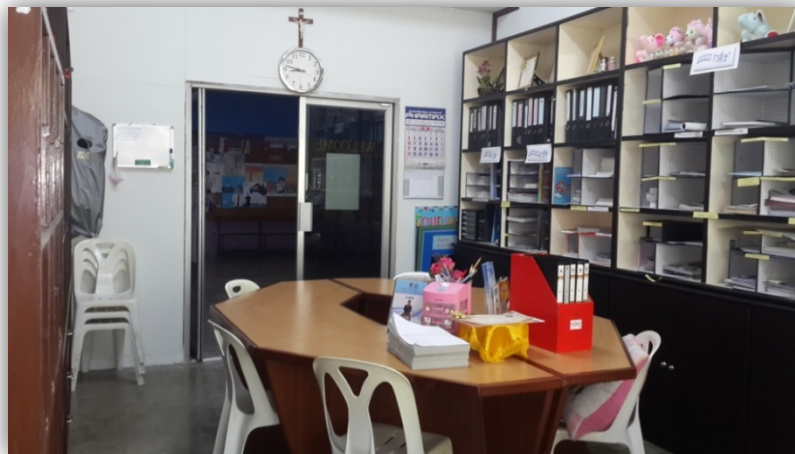
ห้องงานอภิบาล/แนะแนว