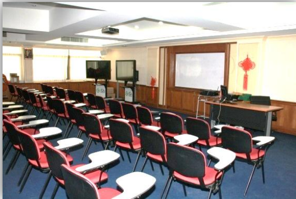
ห้องปฏิบัติการห้องเรียนขงจื้อ