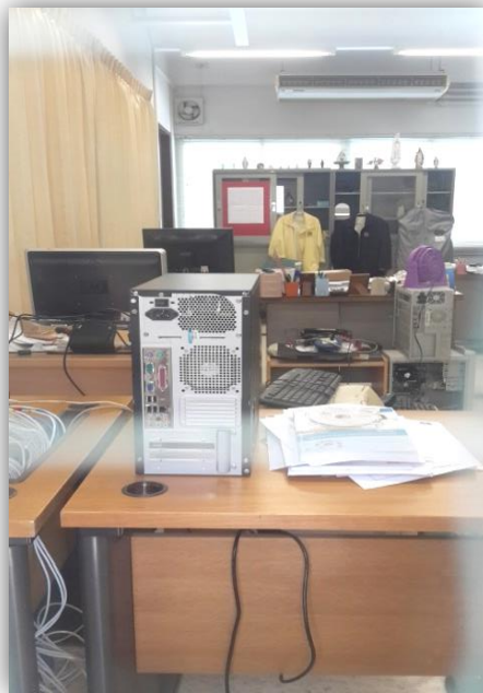
งานเทคโนโลยีสารสนเทศ