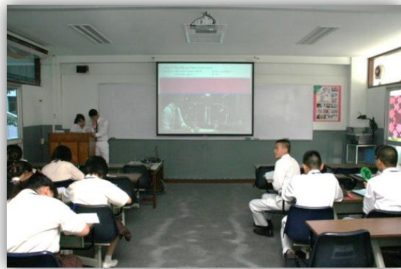
ห้องปฏิบัติการทางภาษา