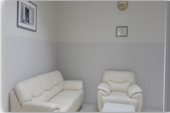
ห้องให้คำปรึกษา หมายเลข 1