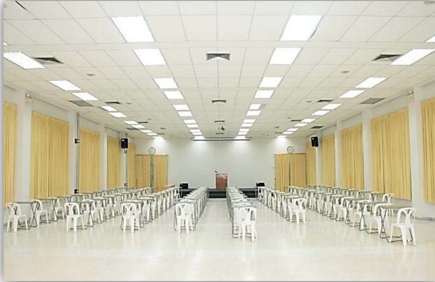
ห้องประชุมเอนกประสงค์

อาคารศตวรรษสมโภช (อาคารคอนกรีตเสริมเหล็ก 4 ชั้น) ประกอบด้วย