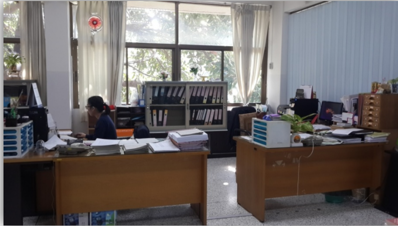
ห้องวิชาการ