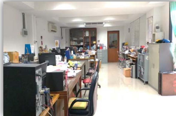
ห้องกิจกรรมนักเรียน

อาคารเฉลิมพระเกียรติ (อาคารคอนกรีตเสริมเหล็ก 3 ชั้น) ประกอบด้วย