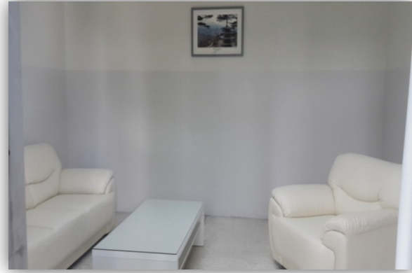
ห้องให้คำปรึกษาหมายเลข 2