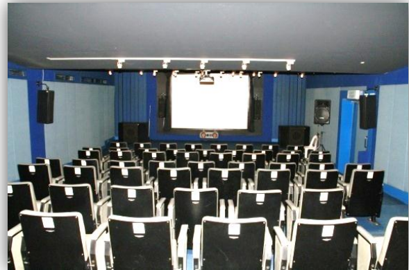
ห้องฉายภาพยนตร์ขนาดเล็ก