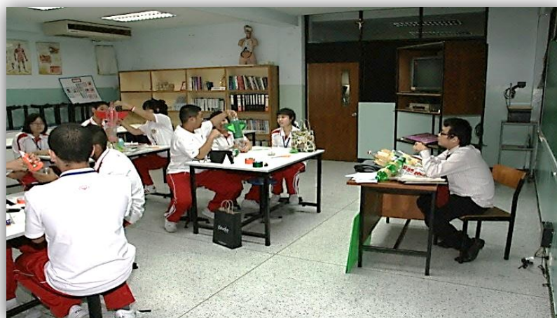
ห้องปฏิบัติการวิทยาศาสตร์