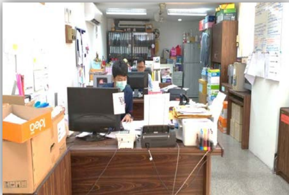
ห้องสมาคมผู้ปกครองและครูฯ (PTA)