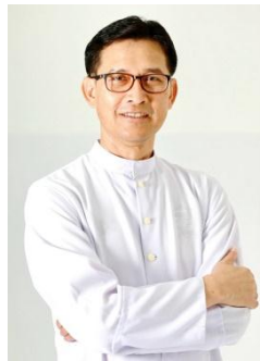
ผู้อำนวยการ / ผู้ลงนามแทนผู้รับใบอนุญาต / ผู้จัดการ