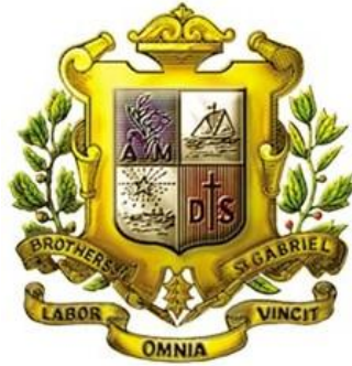
ตรามูลนิธิคณะเซนต์คาเบรียลแห่งประเทศไทย

โรงเรียนนี้มีชื่อว่า โรงเรียนอัสสัมชัญพาณิชย์การ เป็นโรงเรียนในเครือมูลนิธิคณะเซนต์คาเบรียลแห่งประเทศไทย