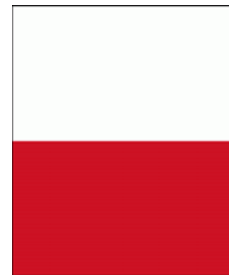
สีประจำโรงเรียน ขาว – แดง

ตราประจำโรงเรียน ประกอบด้วยวงกลมซ้อนกันสองวง วงกลมวงในมีตราสัญลักษณ์ของโรงเรียนในเครือฯ และมีชื่อโรงเรียนเป็นภาษาอังกฤษ “ASSUMPTION COMMERCIAL COLLEGE” อยู่ด้านล่าง ส่วนวงกลมวงนอกมีชื่อโรงเรียนเป็นภาษาไทย “โรงเรียนอัสสัมชัญพาณิชยการ” อยู่ด้านบน และมีข้อความ “เขตสาทร กรุงเทพมหานคร” อยู่ด้านล่าง ซึ่งตราประจำโรงเรียน แสดงถึง สถาบันการศึกษาที่มีความมั่นคง มีคุณภาพในการให้การศึกษา อบรม กล่อมเกลาเยาวชนทุกคนที่เข้ามาเรียนยังสถาบันแห่งนี้