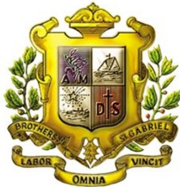
ตรามูลนิธิคณะเซนต์คาเบรียลแห่งประเทศไทย

โรงเรียนนี้มีชื่อว่า โรงเรียนอัสสัมชัญพาณิชยการ เป็นโรงเรียนในเครือมูลนิธิคณะเซนต์คาเบรียลแห่งประเทศไทย